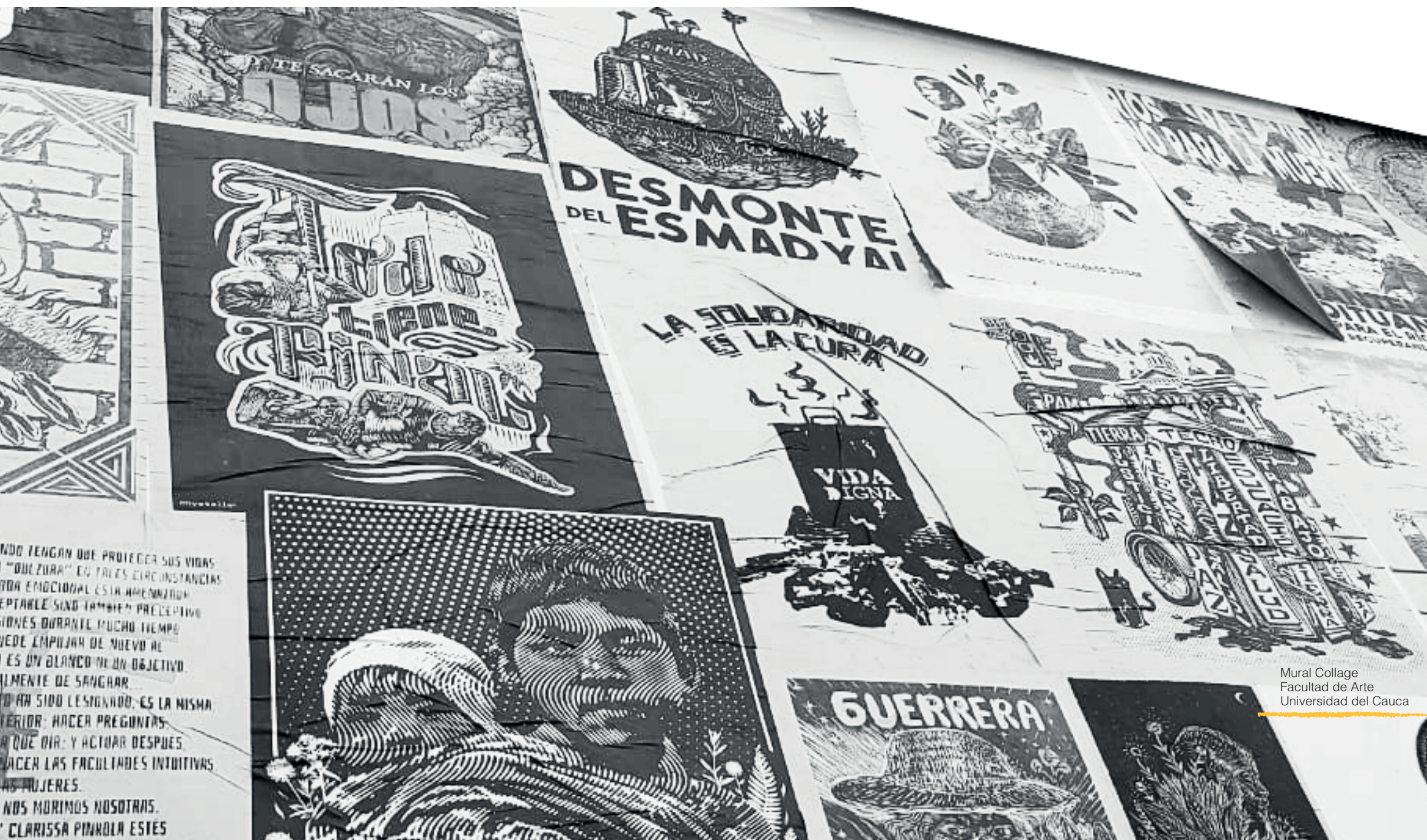
Mural Collage Facultad de Arte Universidad del Cauca

Dentro de todas estas obras se resalta la cantidad de simbolismo que hay en cada una de ellas, desde el color, hasta personajes que se vuelven patrones a la hora de hablar de gráfica patoja. Los colores, rojos, tierras, y amarillos son la representación de una sociedad en pro de la lucha, los colores vivos, como lo son en el mural del Museo de Historia Natural, nos representa la diversidad que hay en nuestra ciudad, acompañado de los diferentes grafitis que se encuentran en el centro histórico.