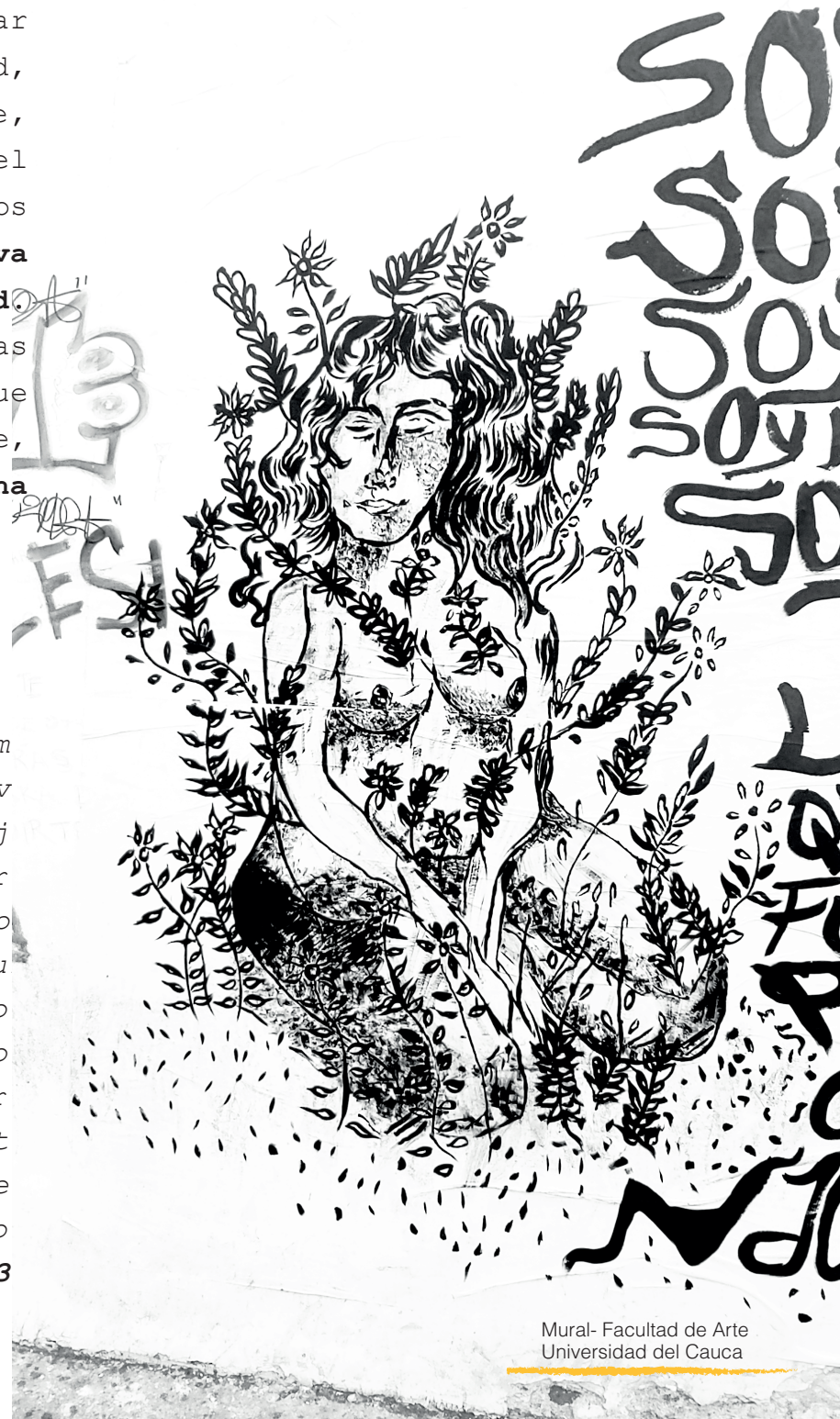
Mural- Facultad de Arte Universidad del Cauca

"Al final la gráfica es otra form que adquiere el lenguaje. Y sirve tanto para transmitir un mensaje reivindicativo, trasgresor impulsador hasta revolucionario Como para difundir ideas u poco más abstractas como lo sentimientos y emociones. Por lo que ilustrar, dibujar graficar puede ser más potente que cualquier grito y a la vez más discreto que un susurro (Chavez, 2023