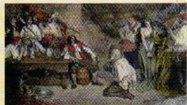
Morgan en el asalto a Portobelo (Panamá).

Henry Morgan ataca Portobelo, enclave estratégico para el transporte de plata a la Península. Tres años después, Morgan destruye Panamá.