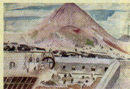
La mina de Potosí producía mucha plata.

Se descubre la mina de plata del Potosí (Perú), que produce el 50% de toda la que se obtiene en el mundo a fines del XVI.